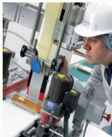
Gemini Flexi-Fold Label